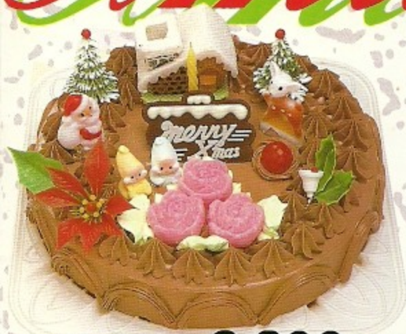
バタークリーム..... チョコ(L) 2,800 円