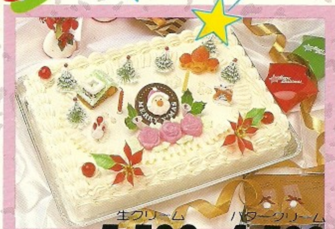
生クリーム バタークリーム 特大角ケーキ 5,500 円・ 4,500 円