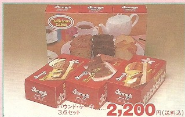
パウンド・ケーキ 3点セット ..... 2,200 円(送料込)