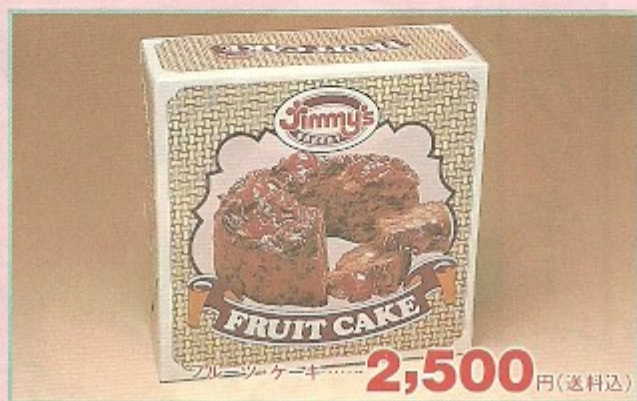
フルーツケーキ ..... 2,500 円(送料込)