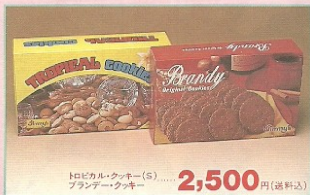
トロピカル・クッキー(S) ブランデー・クッキー ..... 2,500 円(送料込)