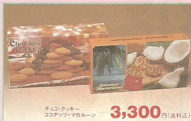
チョコ・クッキー ココナッツ・マカロン ..... 3,300 円(送料込)