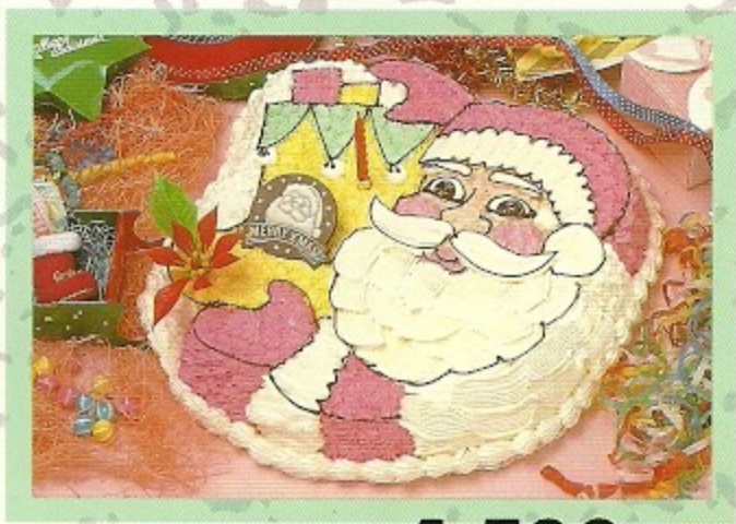
サンタケーキ..... 4,500 円