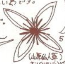
(山原仙人草) ヤンバルレンビ