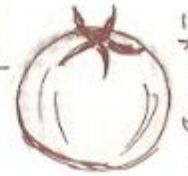
新玉ねぎは 生でサラダも おいしいです

1cm位にスライスして オリーブオイルで両面を 焼いておろして サラダに混ぜると おいしいです