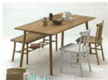
01. DAILY MIX